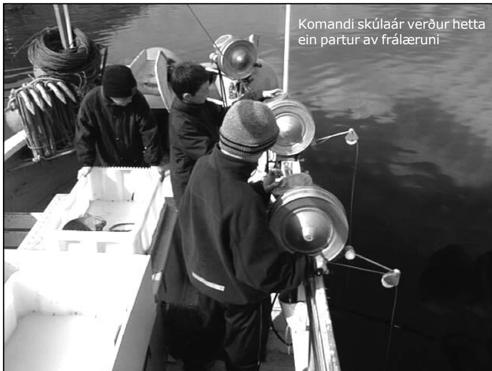
Komandi skúlaár verður hetta ein partur av frálæruni

Bólkurin leggur upp til eina trí ára verkætlan, har tveir ella tríggir skúlar, ymiskir í stódd, eru við. Í næstum fer skriv út til skúlar, har endamálið og tættirnir í undirvísingini verða lögð fram, og heitt verður so á áhugaðar skúlar um at svara, hvussu teir kundu hugsað sær at loyst uppgávuna í verki (lærarakrefur, vitjanir á virkjum, út at rógva við 'egnum' báti o.s.frv.).