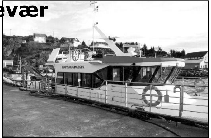
Sjóvegissambandið til Espevær er á hægri støði enn til Mykinesi.

Frá íbúgvunum í Espevær er boðskapurin greiður "menningin má hava grundarlag í lokalsamfelagnum. Bygdin nýðast sjálvar at taka tey stóru tøkini, og har er samanhald tann mest týðandi tátturin. Tað er eisini umráðandi, at søkja sær serkøna hjálp tá eitt stírvíð bygdarsamfelag