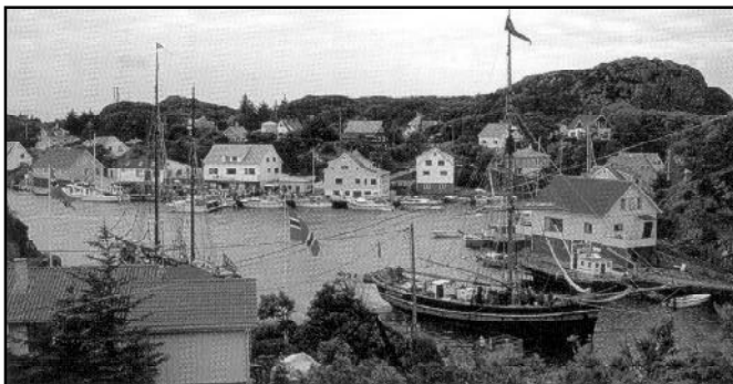
Espevær marknaðarfórir seg í dag sum "ein eksklusivur útpostur, eitt bilfrítt eksotiskt stað at búgva".