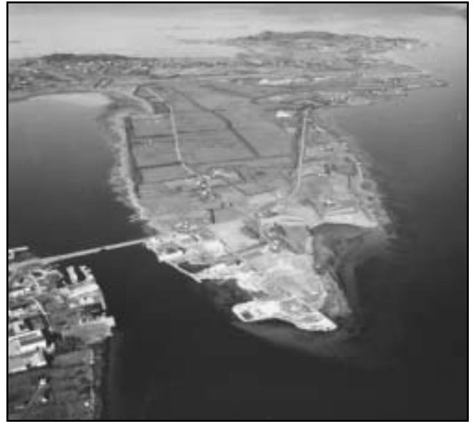
Vigra við Gjøsund. Á Vigra er eisini „portrið“ til Ålesund og økið har. Verkætlanin „Gateway to Sunnmøre“ hjá skotsku fyrirøkuni Gillespies greiðir m.a. frá, hvussu hetta kann vera við til at stimbra menningini í kommununi sum heild

Verkætlanin kallast „Gateway to Sunnmøre“, og heitið sipar til flogvøllin í Vigra í Giske Kommune. Sjóarmiðið er, at kommunan eigur at fáa væl meira burturúr hesum ferðsludepli. Gillespies hevur havt