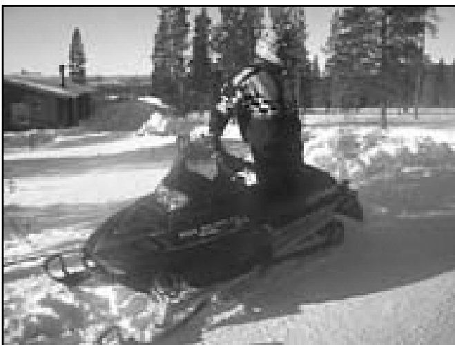
Kavaskotarar verða nóg nýttir, bæði til arbeiðis og frítíðartriv