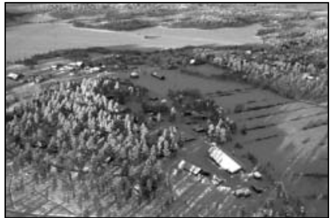
Partur av byggin Drevdagen, sæddur úr loftini

Bygdarfólkið heldur, at tey eru betur før fyri enn bæði lensstýrið og Sveaskog at umsita tilfeingið í skóginum. Millum grundgevingarnar er, at tey hava staðbundnu vitanina um skógarartilfeingið, og eftirsum tey liva í skóginum, so hava tey ongan áhuga í at beina fyri skóginum, men heldur at varðveita hann, soleiðis at hann kann gagnnýttast burðardygt í allari framtíð. Hugsan bygdarfólksins er, at staturin framvegis skal eiga skógarlendið,